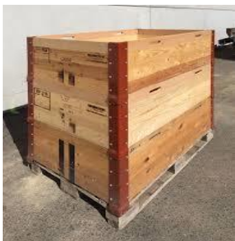
Paletten mit max. 3 Rahmen (wenn nötig mit Auskleidung)