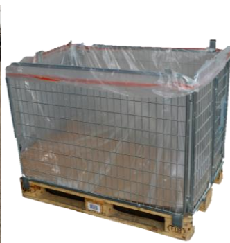
Gitterboxen (wenn nötig mit Auskleidung)